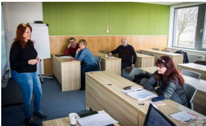
Obrázek 12 – Univerzita třetího věku: výuka jazyků

Fakulta začíná plnit i roli kulturního, společenského a sportovního centra Jindřichova Hradce. Díky aktivitě studentských organizací nabídla místním občanům celou řadu společenských nebo sportovních událostí, kterých se mohli účastnit – např. každoroční reprezentační ples, velkonoční plavecké štafety, divadelní představení spolku FAMA, vernisáže výstav v Knihovnickém a informačním centru, oslavu svátku Halloween, nebo vánoční trhy. V roce 2017 proběhl také první ročník akce „Sportuj s Univerzitním sportovním klubem“. Ta byla zaměřena na hradeckou veřejnost a nabídla jí v rámci jednoho týdne možnost vyzkoušet si zdarma sportovní aktivity realizované tímto klubem.