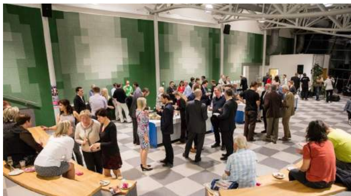
Obrázek 4 – Oficiální oslavy 25 let vysokého školství v Jindřichově Hradci

tosť, Konference studentských parlamentů a organizací zemí V4, oficiální oslavy 25. výročí vysokoškolské výuky v Jindřichově Hradci, nebo oslava svátku Halloween.