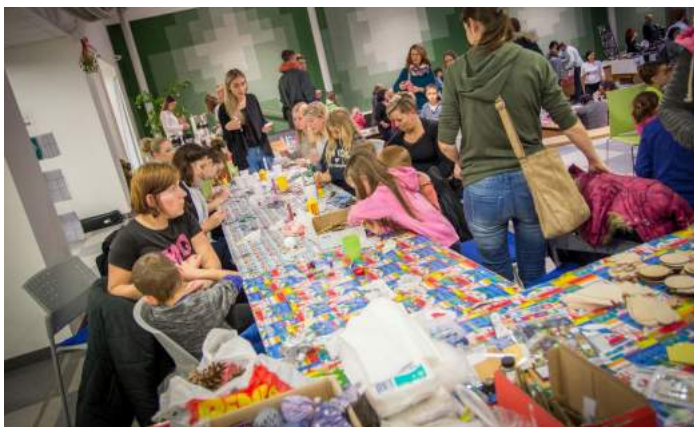
Obrázek 13 – IX. Vánoční trhy

Fakulta začíná plnit i roli kulturního, společenského a sportovního centra Jindřichova Hradce. Díky aktivitě studentských organizací nabídla místním občanům celou řadu společenských nebo sportovních událostí, kterých se mohli účastnit – např. každoroční reprezentační ples, velkonoční plavecké štafety, divadelní představení spolku FAMA, vernisáže výstav v Knihovnickém a informačním centru, oslavu svátku Halloween, nebo vánoční trhy. V roce 2017 proběhl také první ročník akce „Sportuj s Univerzitním sportovním klubem“. Ta byla zaměřena na hradeckou veřejnost a nabídla jí v rámci jednoho týdne možnost vyzkoušet si zdarma sportovní aktivity realizované tímto klubem.