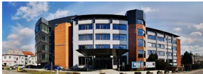
Obrázek 1 – Budova Fakulty managementu

Fakulta managementu sídlí v Jindřichově Hradci na adrese Jarošovská 1117/II, 377 01 Jindřichův Hradec.