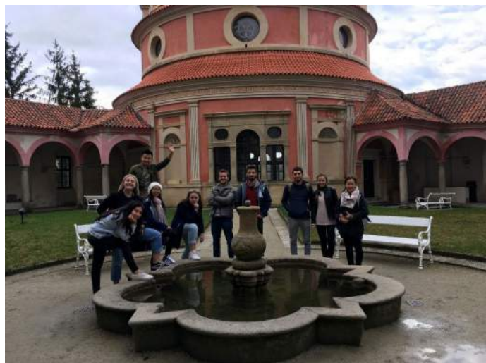
Obrázek 8 – Study and Experience Program

Fakulta se v roce 2017 opět aktivně zapojila i do příjezdové studentské a akademické mobility. Studovali zde dva zahraniční studenti z Turecka a Ruska po dobu zimního semestru, zároveň zde krátkodobě působili dva zahraniční akademičtí pracovníci z Litvy a ze Slovenska. Fakulta i v roce 2017 v rámci svého Study and Experience Program uspořádala pro zahraniční studenty pražských fakult VŠE čtyři týdenní intenzivní kurzy. O ty je mezi studenty stále větší zájem; kurzů v letním semestru se zúčastnilo 12 studentů a kurzů v zimním semestru 19 studentů.