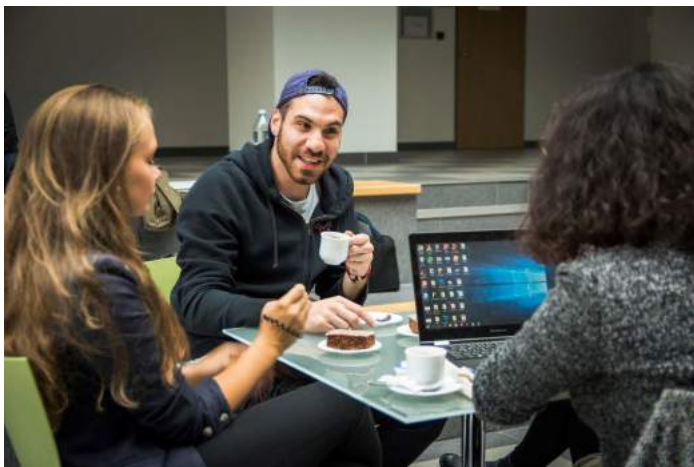
Obrázek 10 – Zahraniční studenti s českými Buddies

Zahraniční studenti jsou do života akademické obce integrováni hlavně díky práci studentských Buddies – českých studentů zapojených do Buddy programu VŠE. Před zahájením výuky mají zahraniční studenti v programu vyhrazeny tři dny věnované orientaci v prostředí Fakulty managementu a také města Jindřichův Hradec, přičemž se jim jejich Buddies intenzivně věnují. Ti jsou jim k dispozici i v průběhu celého semestru a pomáhají jim s řešením každodenních problémů a integrací do fakultního i běžného života. Zahraniční studenti jsou v kontaktu i s koordinátorkou studijních zahraničních výjezdů, která se spolupodílí na organizaci jejich doprovodného programu (výlety, společenské a sportovní akce) a dohlíží na splnění všech formálních náležitostí pobytu. Studenti se rovněž mohou kdykoli obrátit na proděkana pro rozvoj a vnější vztahy.