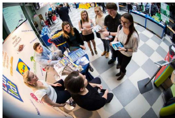
Obrázek 6 – Veletrh pracovních příležitostí 2017

V březnu 2017 byl uspořádán již pátý ročník Veletrhu pracovních příležitostí, kterého se zúčastnili zástupci 21 organizací. V rámci veletrhu se prezentovaly jak regionální subjekty, tak nadnárodní korporace. Proběhly zde také workshopy a semináře a studenti mohli navázat prvotní styk se svými budoucími zaměstnavateli. Je velmi pozitivní, že meziročně tato akce získává na vážnosti a počet zúčastněných firem dosahuje maxima možného (s ohledem na kapacitní omezení prostor fakulty).