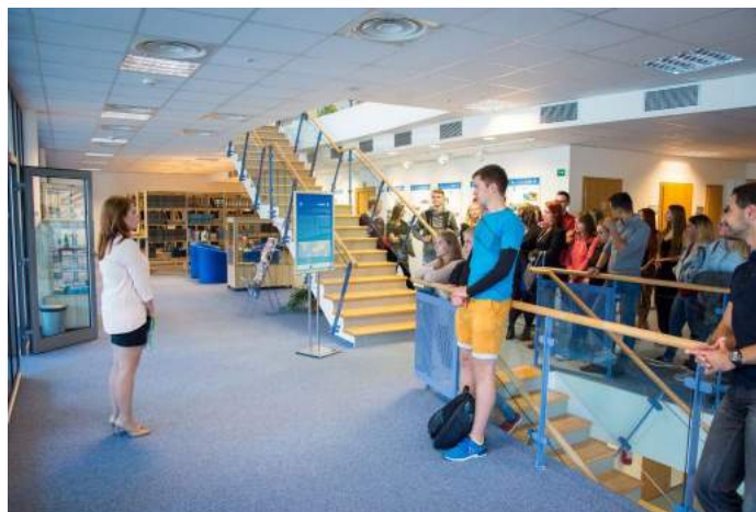
Obrázek 9 – Vernisáž výstavy Naši studenti ve světě 2017

Fakulta managementu všechny formy mobility výrazně podporuje. Výjezdy podporuje zprostředkováním informací z Oddělení zahraničních styků VŠE na fakulním webu a také informačními schůzkami, administrativně prací koordinátorky studijních zahraničních výjezdů a proděkana pro rozvoj a vnější vztahy a u studentů rovněž i finančně z prostředků stipendijního fondu podle jasně stanovených pravidel. Určitou formu podpory představují i akce zaměřené na zahraniční mobilitu, jako jsou tzv. International Days, studentské přednášky, workshopy, nebo již tradiční každoroční výstava Naši studenti ve světě.