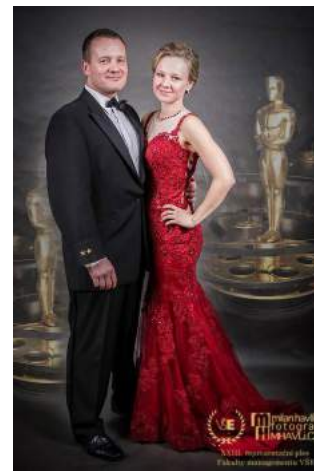
Obrázek 5 – XXIII. reprezentační ples Fakulty managementu

Významný je rovněž osobní kontakt s absolventy při příležitosti pořádání různých společenských akcí. Mezi ty významné patřil reprezentační ples fakulty v březnu; v květnu a v říjnu to pak byly oslavy 25. výročí vysokoškolské výuky v Jindřichově Hradci. Absolventi jsou zváni i na menší akce, jako jsou divadelní představení spolku FAMA, vánoční trhy nebo již tradiční adventní prohlídka Jindřichova Hradce „Půjdem spolu...“