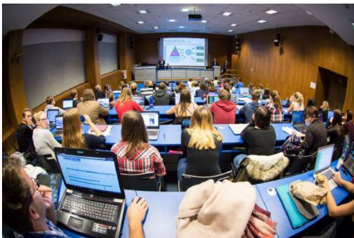
Obrázek 3 – Přednáška Ministerstva financí ČR

projektů financovaných z EU fondů“ či semináře organizované Centrem knihovnických a informačních služeb VŠE (vyhledávání v elektronických informačních zdrojích a v citačních rejstřících).