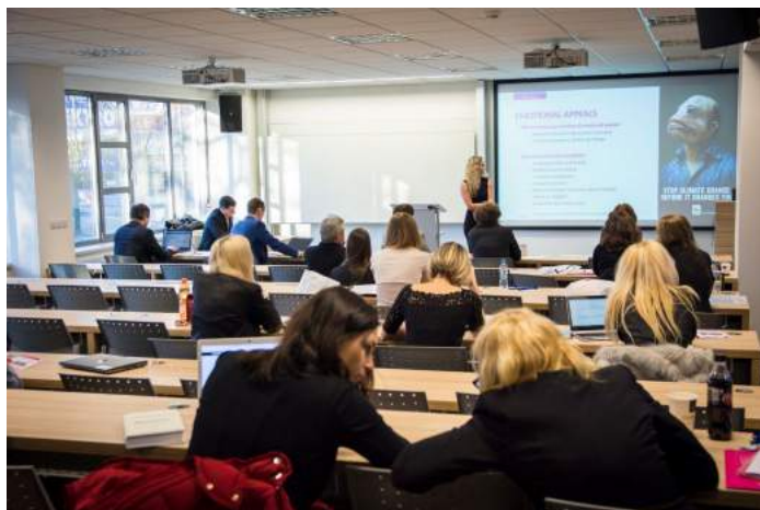
Obrázek 11 – Vědecká konference doktorandů a mladých vědeckých pracovníků 2017

Fakulta managementu každoročně pořádá i vědeckou konferenci doktorandů a mladých vědeckých pracovníků. Každý student doktorského studia má za povinnost alespoň jednou za studium na této konferenci vystoupit. Konference má přítom podobu spíše diskusní platformy, na které se studentům dostane podrobné zpětné vazby k jejich výzkumným záměrům či výsledkům.