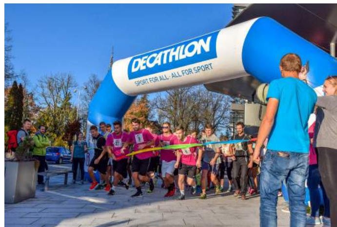
Obrázek 7 – Alfa Run 2017

Tyto marketingové aktivity byly v roce 2017 podpořeny realizací jednorázových akcí zaměřených na středoškolské studenty. Díky spolupráci s místním Parlamentem mládeže byly na fakultě v listopadu 2017 uspořádány dvě přednášky přímo pro středoškolské studenty, o které byl mezi nimi velký zájem. Dále se studenti účastnili i sportovních akcí, jako byla Hradecká hodinovka (duben), Alfa Run (říjen), nebo Vánoční plavecké štafety (prosinec). Studenti středních škol fakultu poznávají i díky kulturním akcím, populární jsou např. představení fakultního divadelního spolku FAMA (květen a prosinec), příp. oslava svátku Halloween (říjen).