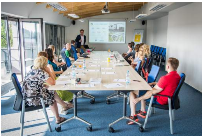
Obrázek 9 – Seminář Nástupnictví v rodinných firmách 2018

Fakultě se daří spolupracovat s mnoha podnikatelskými subjekty v regionu. Jde především o zprostředkování odborné praxe pro studenty fakulty, zpracování kvalifikačních prací, či přímé zapojování odborníků z regionálního trhu práce do výuky. V rámci řešení projektu „Interreg CENTRAL EUROPE: ENTER-transfer: Advancement of the economic and social innovation through the creation of the environment enabling business succession“ se specificky zaměřuje na problematiku nástupnictví v rodinných firmách, kterých v regionu působí celá řada. Přenáší tak poznatky z akademické sféry do podnikatelské praxe s cílem usnadnit mnohdy nelehký proces předávání rodinné firmy nástupcům.