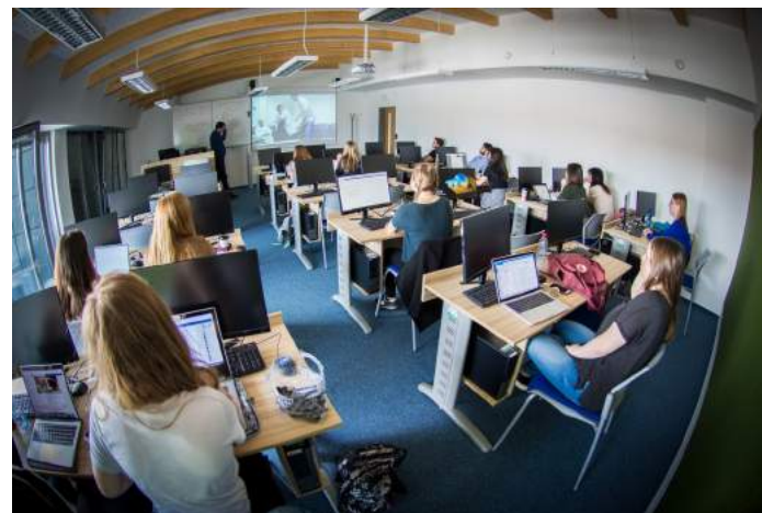
Obrázek 6 – Study and Experience Program 2018

Příjezdová mobilita není s ohledem na velikost fakulty a především její umístění v malém městě tak intenzivní. V roce 2018 zde bohužel nestudoval žádný výměnný student. Na druhou stranu počet přijíždějících akademiků se fakultě podařilo navýšit na pět. Na fakultě tak působili akademičtí pracovníci z Turecka, Litvy (2) a Slovenska (2). Úspěšným byl nadále tzv. Study and Experience Program, který je orientován na zahraniční studenty pražských fakult VŠE. Nabízí jim možnost studovat jeden intenzivní kurz v rozsahu 3 ECTS a zároveň poznat fakultu, Jindřichův Hradec a jeho okolí. Programu se v letním semestru zúčastnilo 19 studentů, v zimním semestru na fakultě studovalo 18 zahraničních studentů.