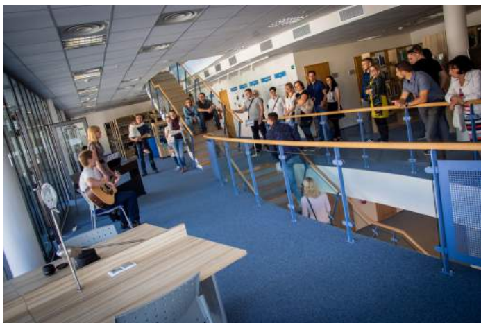
Obrázek 3 – Homecoming 2018

funkci tiskového mluvčího JE Temelín. V říjnu 2018 rovněž proběhlo oficiální setkání absolventů s názvem Homecoming 2018: Domov je na jihu. O toto celodenní setkání byl mezi absolventy tradičně velký zájem. Měli možnost podívat se do celé budovy fakulty, potkat současné i bývalé zaměstnance, vidět vernisáž výstavy Naši absolventi a hlavně se potkat mezi sebou.