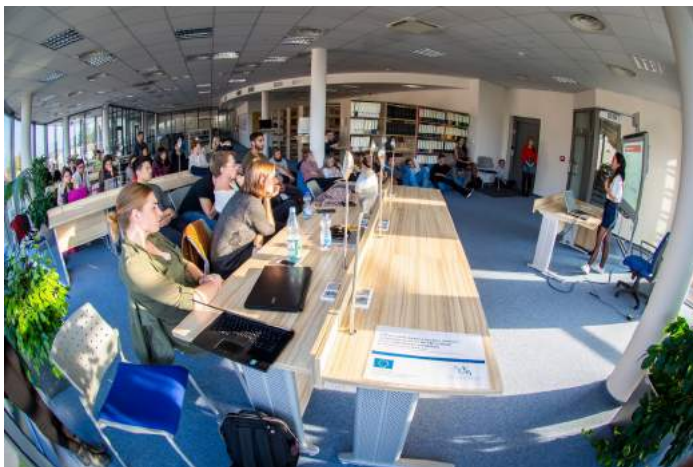
Obrázek 7 – International Days 2018

styků VŠE na fakultním webu, organizací informačních schůzek, administrativně prací koordinátorky zahraničních výjezdů a proděkana pro rozvoj a vnější vztahy a rovněž i finančně z prostředků stipendijního fondu. Určitou formu podpory představují i akce zaměřené na zahraniční mobilitu, jako jsou tzv. International Days, studentské přednášky, workshopy, nebo již tradiční každoroční výstava Naši studenti ve světě, které probíhají i díky podpoře projektu Rozvoj vzdělávací a dalších činností a podpora kvality na VŠE v Praze (CZ.02.2.69/0.0/0.0/16_015/0002342). V roce 2018 byla nově založena skupina na síti Facebook „Zahraníční výjezdy na FM VŠE“, která je zaměřena na sdílení informací a zkušeností s výjezdy. Novinkou byla také fotosoutěž, do které mohli studenti přihlásit fotografie ze svých výjezdů. Prvního ročníku soutěže se zúčastnilo 9 studentů, kteří přihlásili 27 fotografií.