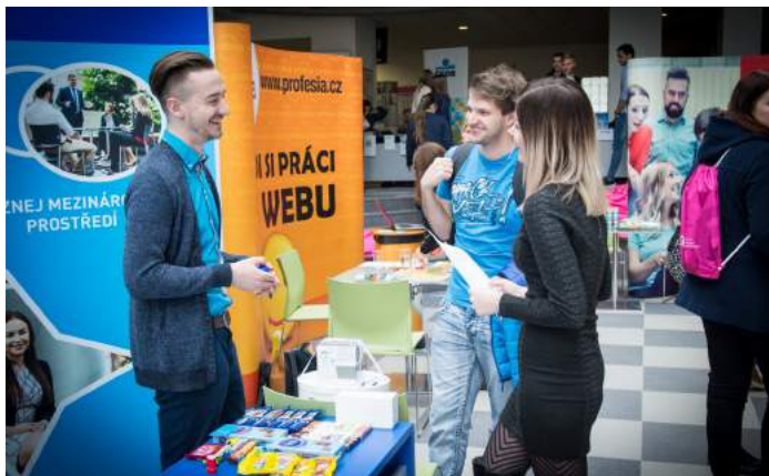
Obrázek 4 – Veletrh pracovních příležitostí 2018