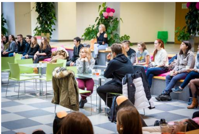
Obrázek 5 – Den studentem FM VŠE 2018

než 30 studentů středních škol. Akce tak bude realizována s drobnými obměnami i v dalších letech a vhodně doplní již tradiční Dny otevřených dveří.