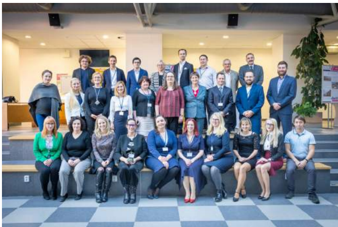
Obrázek 8 – Vědecká konference doktorandů a mladých vědeckých pracovníků 2018

Fakulta managementu každoročně pořádá i vědeckou konferenci doktorandů a mladých vědeckých pracovníků. Každý student doktorského studia má za povinnost alespoň jednou za studium na této konferenci vystoupit. Konference má přitom podobu spíše diskusní platformy, na které se studentům dostane podrobné zpětné vazby k jejich výzkumným záměrům či výsledkům.