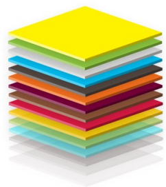
HRANY UNI BARVY 700