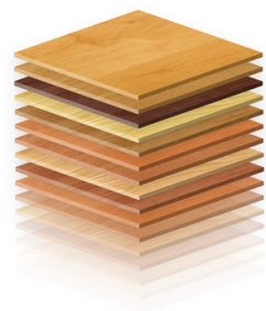
HRANY DŘEVO DEKORY 1 200